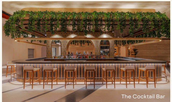
The Cocktail Bar